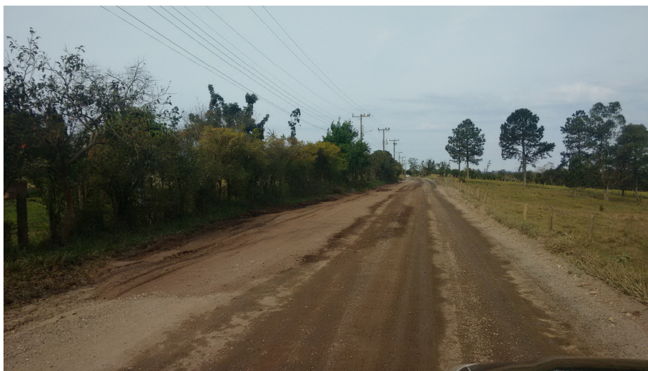
ALARGAMENTO ACOSTAMENTO RODOVIA MR 370 – 1320,00m