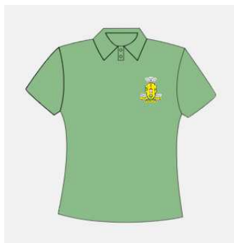
Imagem 7 - layout item 7 (camiseta gola pólo feminina).