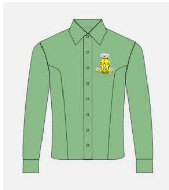
Imagem 4 - layout item 4 (camisete social feminina).