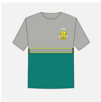
Imagem 1 - layout item 1 (camiseta manga curta com faixa reflexiva).