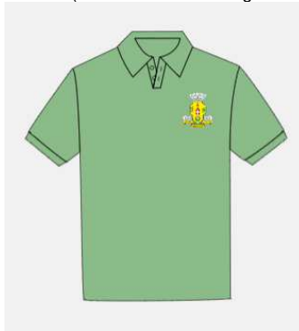
Imagem 6 - layout item 6 (camiseta gola pólo masculina).