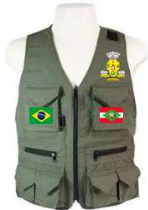
Imagem 15 - layout item 15 (colete parque).