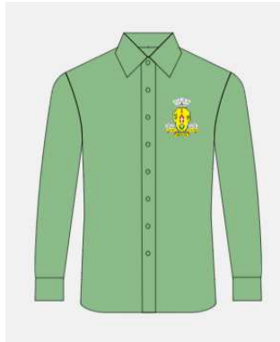
Imagem 3 - layout item 3 (camisa social masculina).