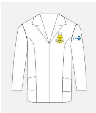
Imagem 9 - layout item 9 (jaleco da saúde feminino).