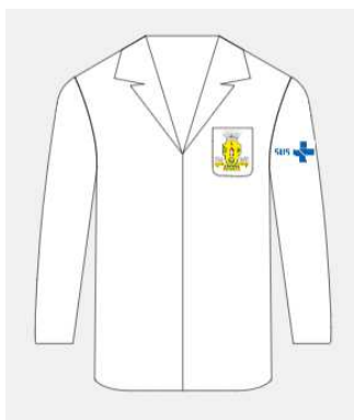
Imagem 8 - layout item 8 (jaleco da saúde masculino).