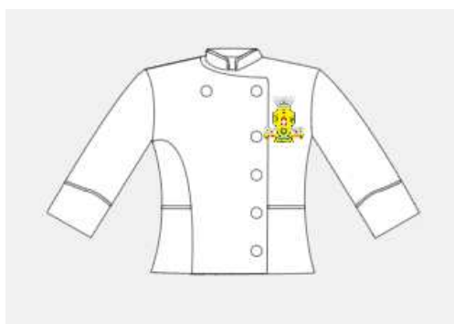
Imagem 11 - layout item 11 (dolman manga curta).