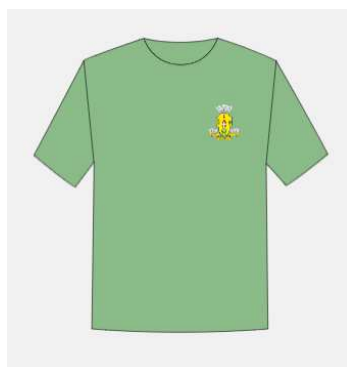
Imagem 13 - layout item 13 (camiseta).