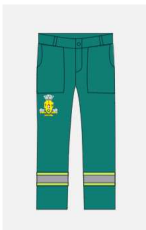
Imagem 2 - layout item 2 (calça com faixa reflexiva).