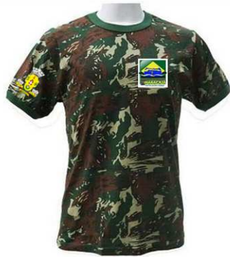
Imagem 14 - layout item 14 (camiseta parque).