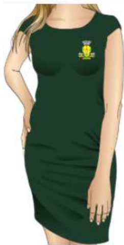
Imagem 5 - layout item 5 (vestido tubinho manga curta estilo japonesa).